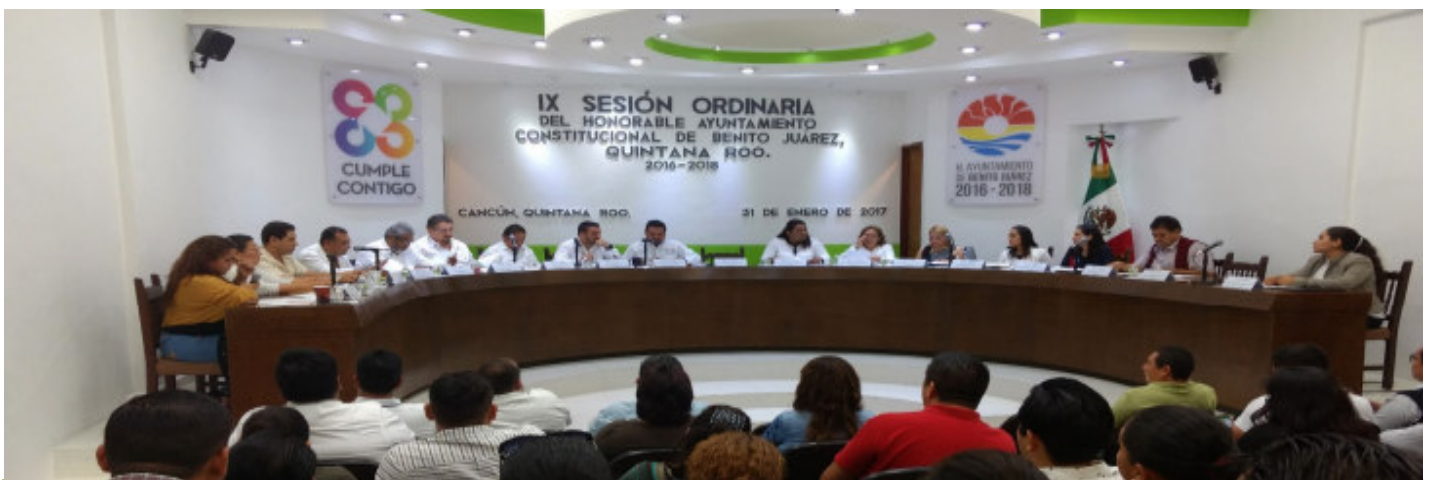
❖ Novena Sesión Ordinaria de fecha 31 de Enero del año 2017.

En esta Sesión presenté una iniciativa para la formación de un Comité Especial para lo referente a las solicitudes de Expo-Ferias, mismo que se encuentra en trámite en Comisiones