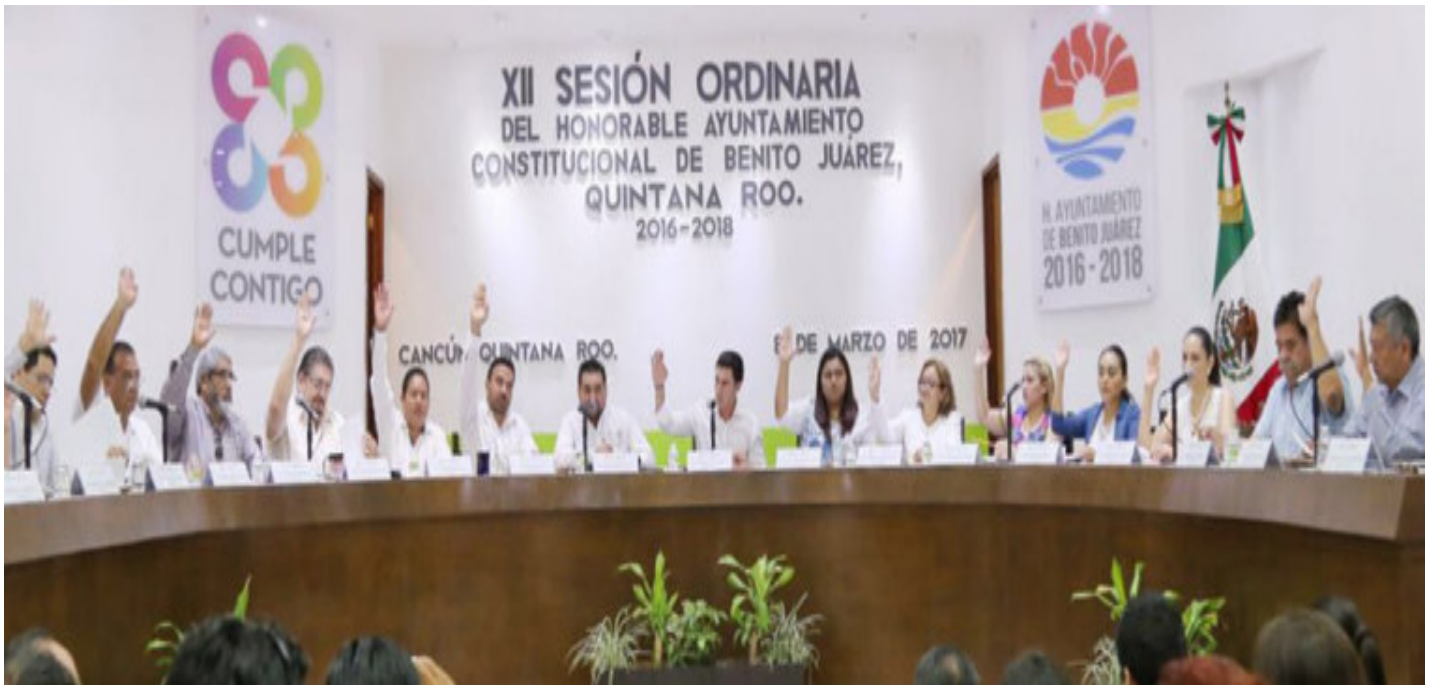
★ Décima Segunda Sesión Ordinaria de fecha 8 de Marzo del año 2017.