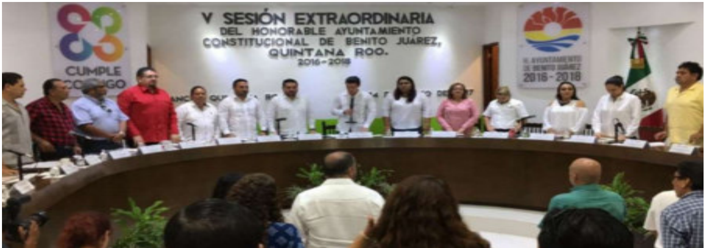
★ Quinta Sesión Extraordinaria de fecha 24 de Marzo del año 2017.

Durante el período que se informa, el H. Ayuntamiento celebró 1 Sesiones en la que se tuvo presencia y participación, realizándose en la siguiente fecha: