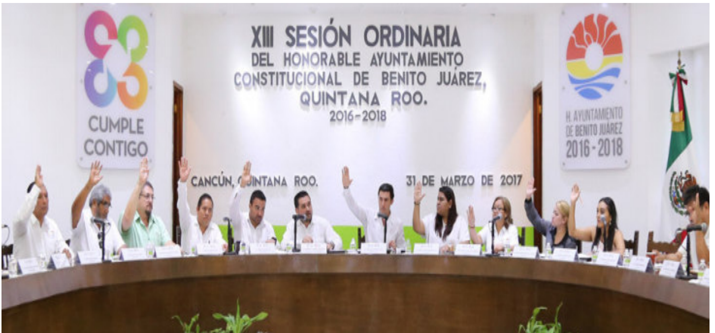
★ Décima Tercera Sesión Ordinaria de fecha 31 de Marzo del año 2017.