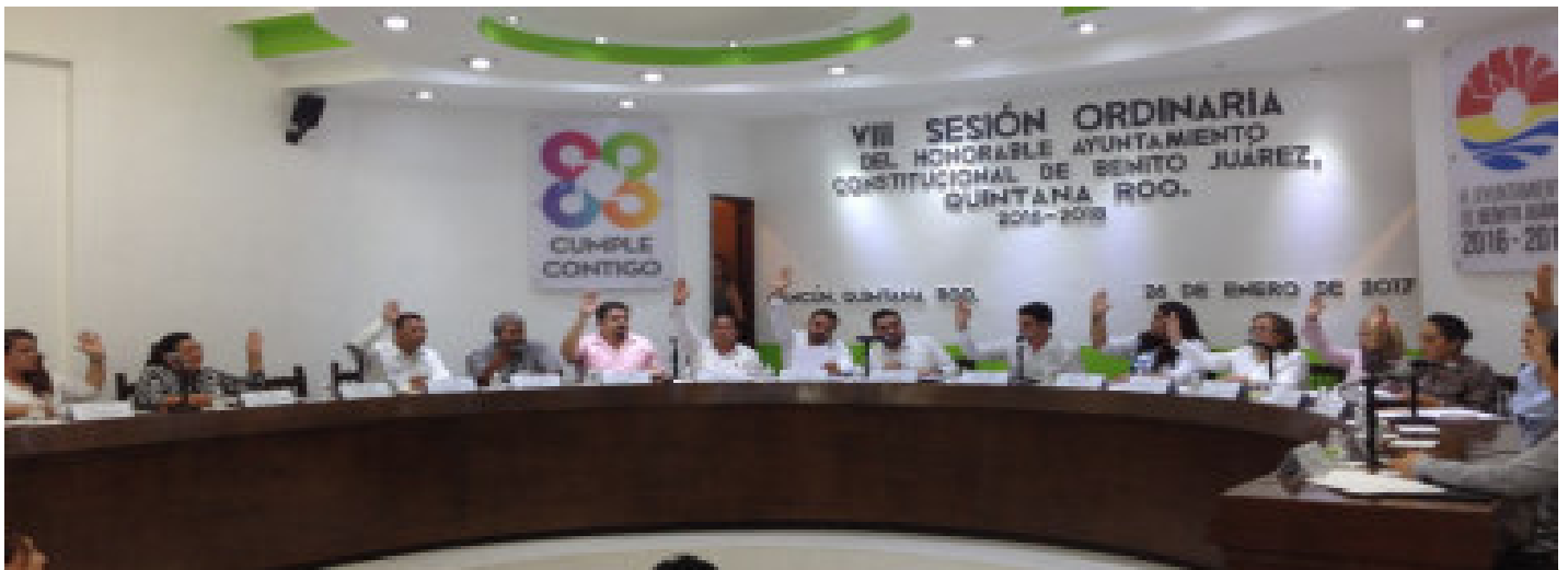
❖ Octava Sesión Ordinaria de fecha 26 de Enero del año 2017.

Durante el período que se informa, el H. Ayuntamiento celebró 6 Sesiones en la que se tuvo presencia y participación, realizándose en las siguientes fechas: