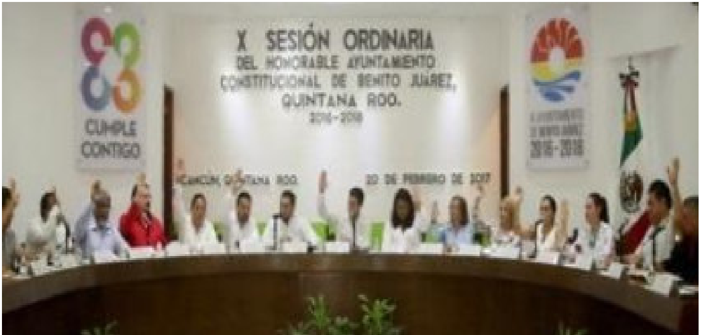
❖ Décima Sesión Ordinaria de fecha 20 de Febrero del año 2017.