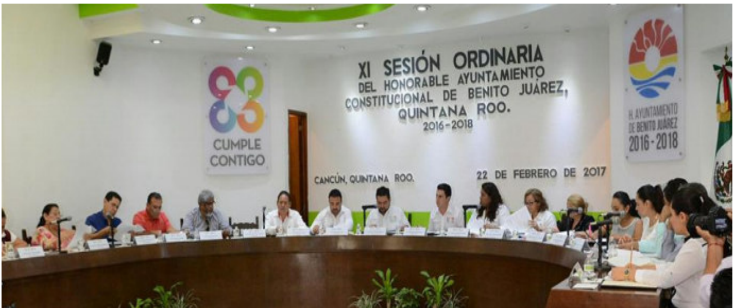
❖ Décima Primera Sesión Ordinaria de fecha 22 de Febrero del año 2017.