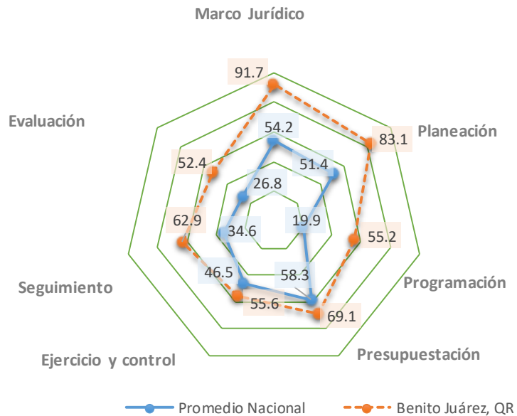
Porcentaje de Avance Sección PbR-SED por Categoría